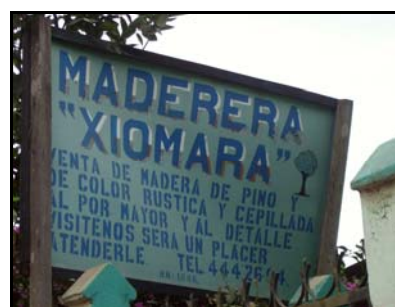
Imagen 1. Rotulo del depósito de venta de madera “Maderera Xiomara”

En ese sentido el CONADEH, a través de técnicos del Proyecto MFI en conjunto con personal de la Región Forestal del Atlántico de la AFE-COHDEFOR realizaron una inspección de rutina 3 en la zona oriental de esta región, visitando el depósito de “Maderera Xiomara 4 ” ubicado en el barrio Los Laureles de Tocoa, departamento de Colón.