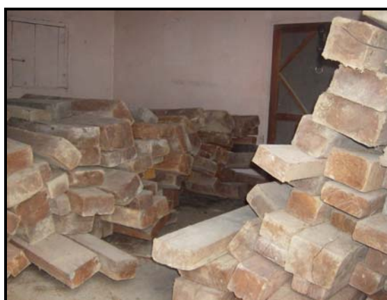
Imagen 4. Vista parcial de los lotes No. 2 y 3 de madera de caoba.

Procediéndose a informar de inmediato al Ministerio Público de Tocoa, tal como lo establece el Artículo 104 de la Ley Forestal, Áreas Protegidas y Vida Silvestre “... a iniciar la investigación correspondiente para verificar su legítima procedencia a través del Ministerio Público a quien deberá informar de inmediato” y a realizar el inventario de esta madera.