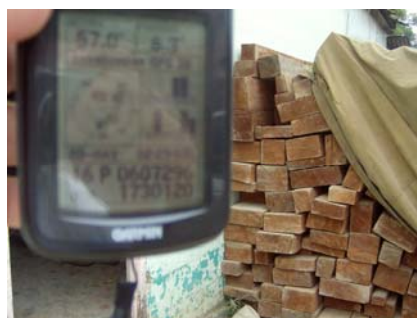
Imagen 2. Vista parcial de lote de madera encontrado en Maderas Xiomara (coordenadas X=0607296, Y=1730120)

Solicitándose a la propietaria, las guías de movilización o facturas originales codificadas que acrediten la procedencia y legalidad en la adquisición de esta madera.