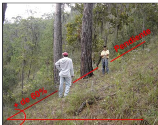
Cuadro 2. Área y porcentaje por unidad de corte Con pendientes mayores a 60%

Como puede observarse en el cuadro 2, la unidad de corte 2, es que presenta la mayor área con este tipo de pendientes.